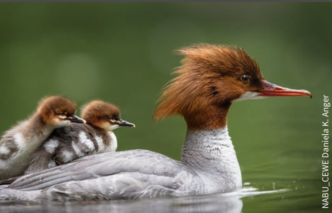
NABU_CEWI Daniela K. Anger

weitere Tierarten werden für Konflikte der Landnutzung und Fischwirtschaft verantwortlich ge- macht. Anstatt die wahren Ursachen für Probleme und politische Versäumnisse zu bearbeiten, geraten ungerechtfertigt Wildtiere ins Visier.